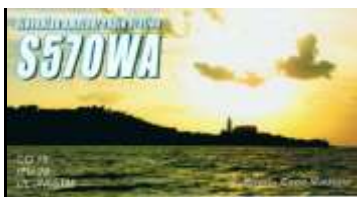
L - Listrie Slovène ( Piran )