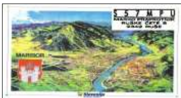
S - Basse Styrie ( Maribor )