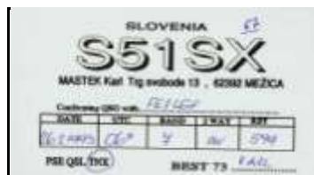
C - Carinthie Slovène ( Mezica )