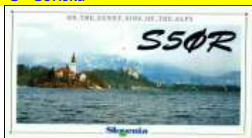
IC - Carniole Intérieure ( Idrija )