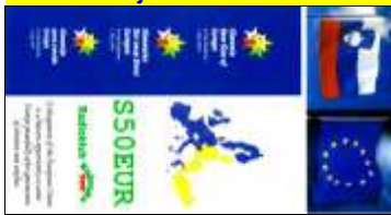
Entrée de l'€ en Slovénie