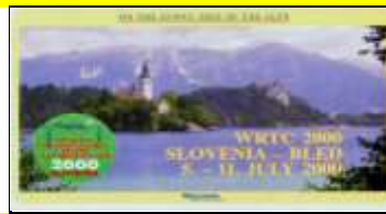
WRTC 2000 en Slovénie