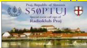
Festival de PTUJ