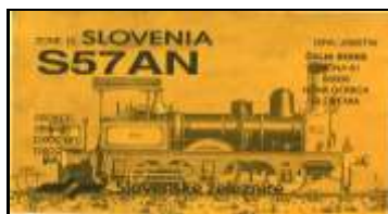
G - Goriska