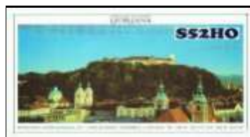
Capitale : Ljubljana