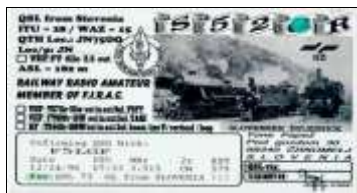
LC - Basse Carniole ( Cromelj )