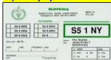
UC - Haute Carniole ( Kranj )