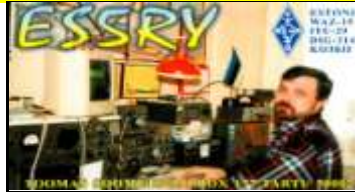
ES5 - Tartumaa - Tartu