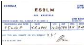
ES2 - Har jumaa - Rajon