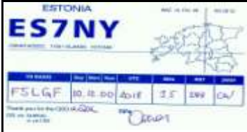
ES7 Viljandimaa - Viljandi