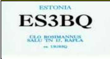
ES3 - Raplamaa - Rapla