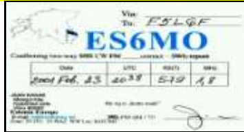
ES6 Vorumaa - Võru