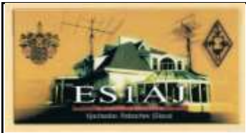
ES1 - Tallinn