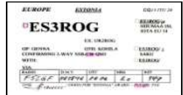
ES3 - Läänemaa - Haapsalu