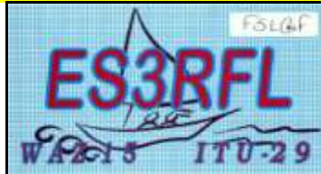
ES3 Jarvamaa - Paide