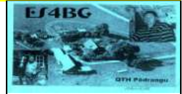
ES4 - Lääne-Virumaa - Rakvere