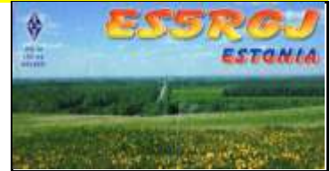
ES5 - Jogeamaa - Jogeva