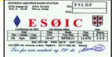
ES0 Saaremaa Is - hiiumaa Is