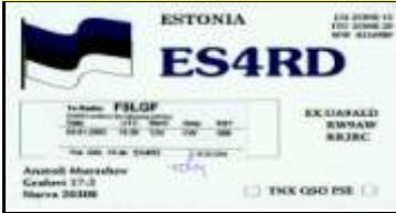
ES4 - Ida-Viru - Narva