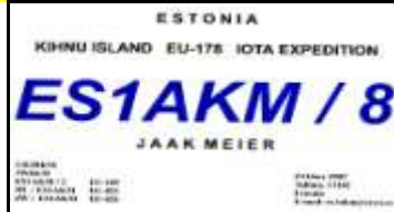
ES8 Pärnumaa - Parnu