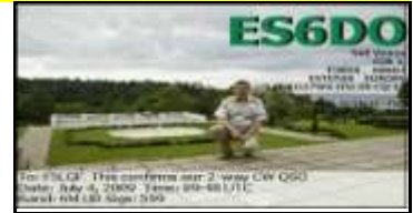
ES6 Valgamaa - Valga