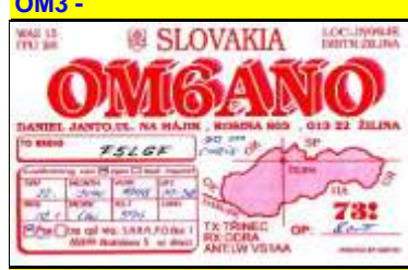
OM6 - Zilina