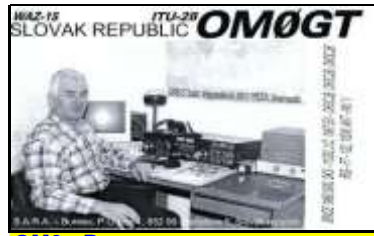
OM0 - Presov

Nota : Les préfixes Radioamateurs sont calqués sur les Régions administratives de la Slovaquie. Le chiffre 3 semble avoir une connotation Nationale.