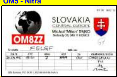
OM8 - Kosice