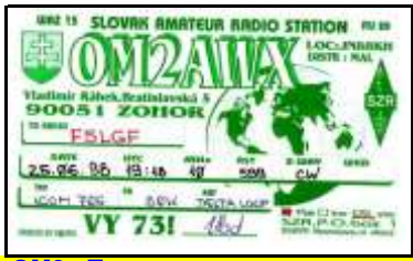
OM2 - Trnava