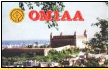
OM1 - Bratislava