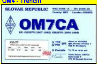
OM7 - Banska Bystricka