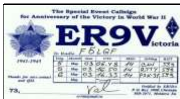
Ann. 2ème Guerre Mondiale