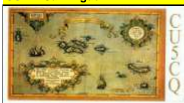
CU5 San Jorge