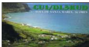
CU1 Santa Maria