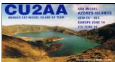
CU2 San Miguel