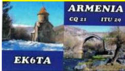
7 - Artik ( Shirak )