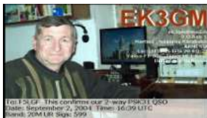
Martuni ( Nagorny Karabagh )