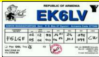
7 - Gyumri ( Shirak )