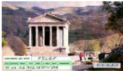
11 - Yerevan