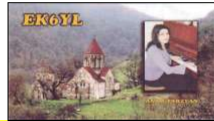
7 - Artik ( Shirak )