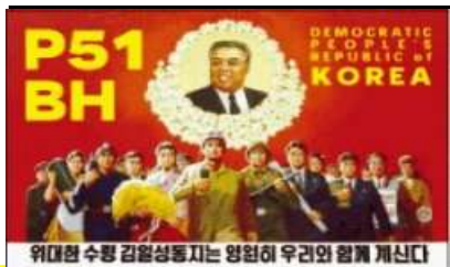
Expédition 1999 QSL de OH2BN