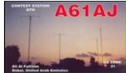
1 - Emirat de Dubaï