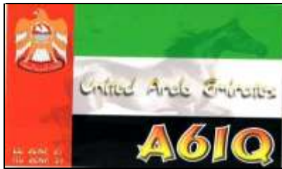
5 - Sharjah ( Emirat de Hajman )