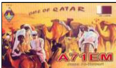
1 - Doha ( Al Dawhah )