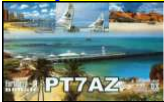
PT7 - Ceara