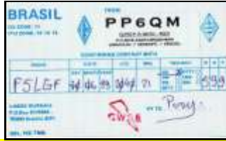
PP6 - Sergipe