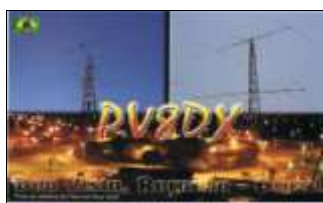
PV8 - Roraima