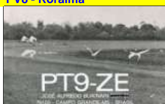
PT9 - Mato Grosso do Sul