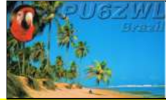
PY6 - Bahia