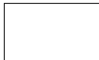
PW8 - Rondonna