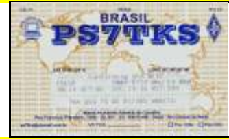
PS7 - Rio Grande Norte