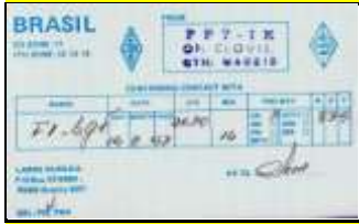
PP7 - Alagoas