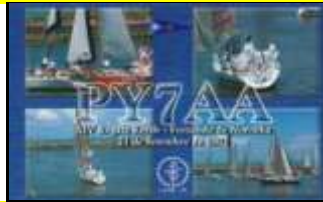
PY7 - Pernambuco