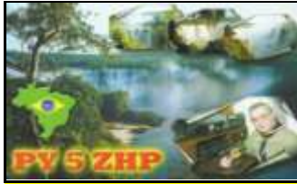
PY5 - Parana