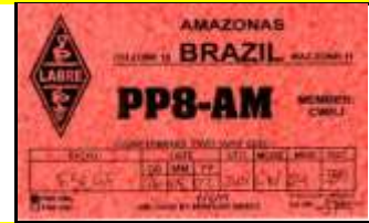
PP8 - Amazonas