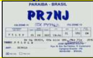
PR7 - Paraiba