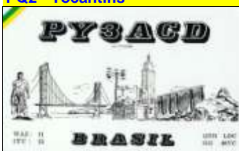
PY3 - Rio Grande Sul