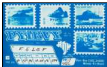
PY1 - Rio de Janeiro