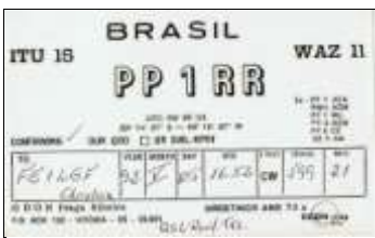
PP1 - Espérito Santo