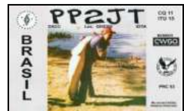
PP2 - Goiás