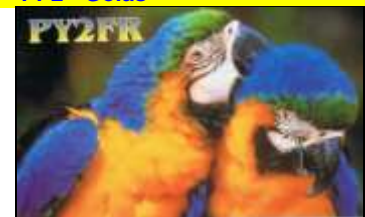
PY2 - Sao Paulo