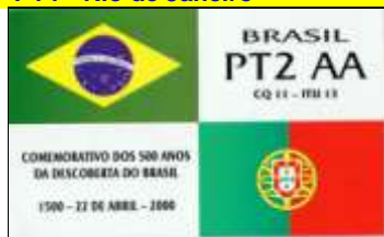
PT2 - District Fédéral