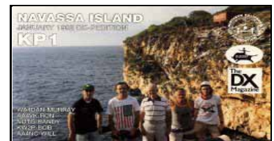
Expédition 1992 QSL de F6HMJ