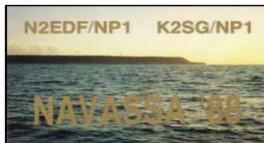
Expédition 1988 QSL de F6AJA