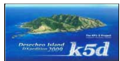
DX-Pédition Février 2009