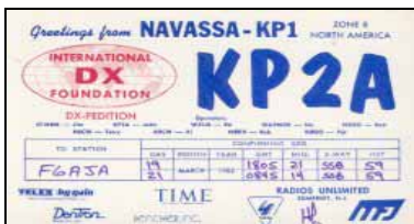
Expédition 1982 QSL de F6AJA