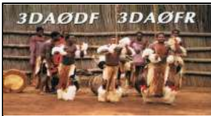
Mountain Inn Mbabane