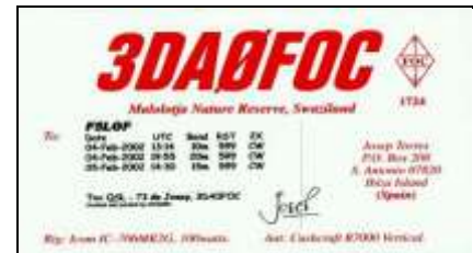
Malolotja Nature Réserve