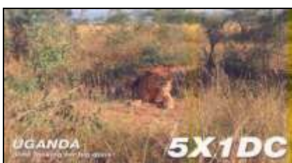
Sseese Island ( Lac Victoria )