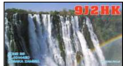
Lusaka ( Pro. de Lusaka )