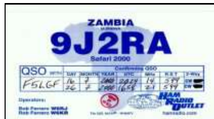
Mumbwa ( Pro. Centrale )