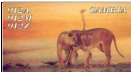
Lusaka ( Capitale )