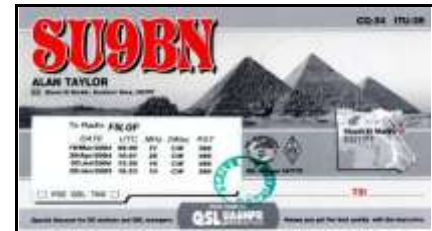
Sharm El Sheikh ( Sud Sinaï )